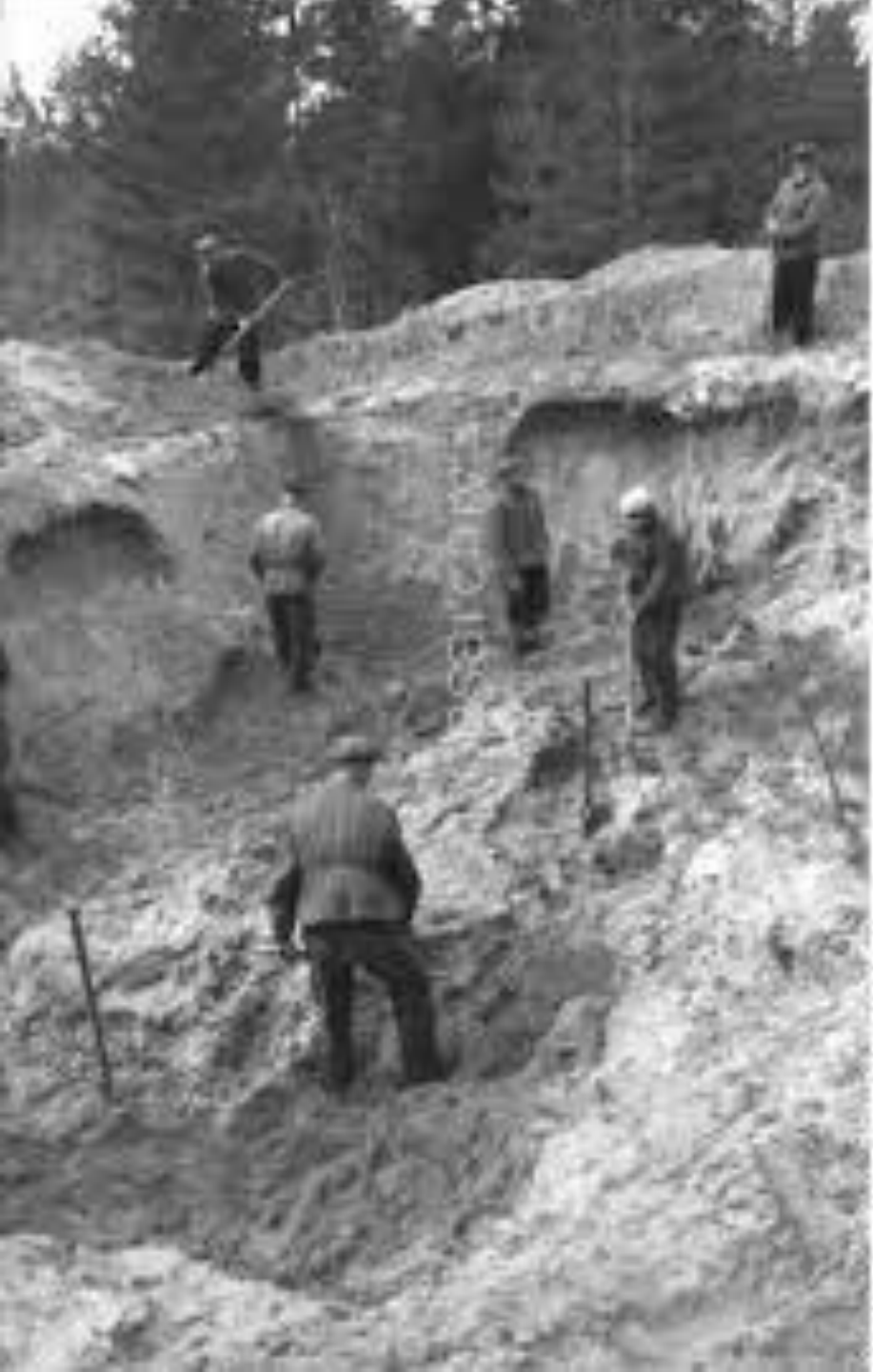
Quadrantowy, Biał 1011 152, 1946-20A Foto: K. Kozłowski, (Lutego) 1943, Muzeum, April